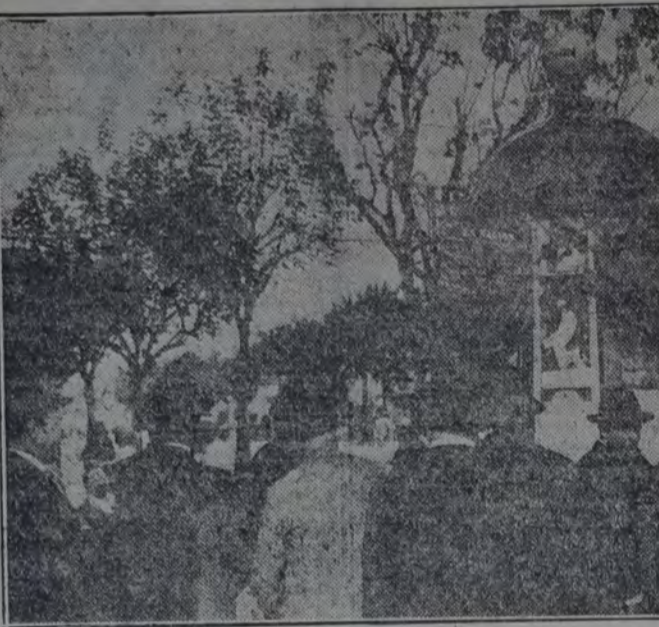
QUIOSCO DE "LA NACION", EN EL CRUCE DE LAS CALLES SAN JUAN Y BOEDO, CON LA MORALIZADORA PIZARRA DE LAS CARRERAS. EN SAN JUAN Y RIOJA, 5 CUADRAS MAS ABAJO, HAY OTRO QUIOSCO Y OTRA PIZARRA. "LA NACION" NO DESCUIDA A SU CLIENTELA!

Para ser más grande diario que su rival de la avenida de Mayo, "La Nación" instaló en la ciudad numerosos quioscos, iguales al modelo que hoy reproducimos. La función de todos y cada uno de esos quioscos, símbolos del periodismo moderno y objetivo, consiste en recoger suscriptores, avisos, llamar a los bomberos y a la asistencia pública, escribir en la pizarra las