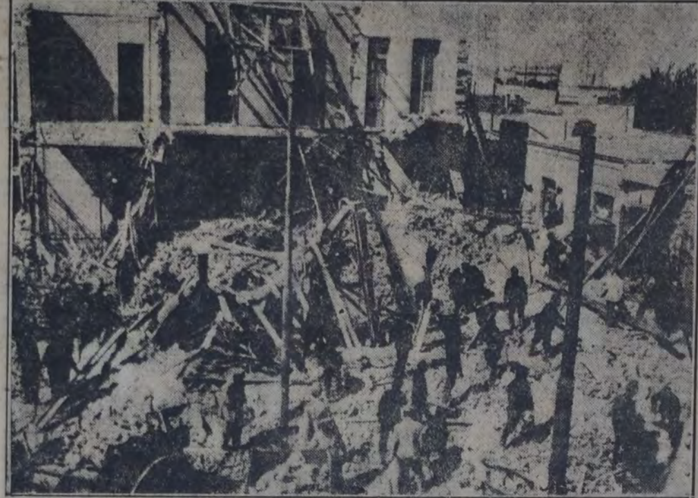
VISTA GENERAL DEL LUGAR DE LA CATÁSTROFE