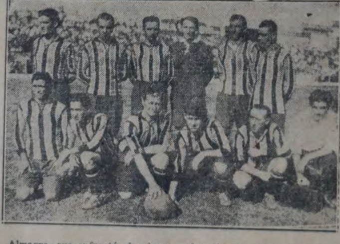
Almagro, que enfrentó al primer equipo de Boca Juniors, oponiéndole una tenaz resistencia.