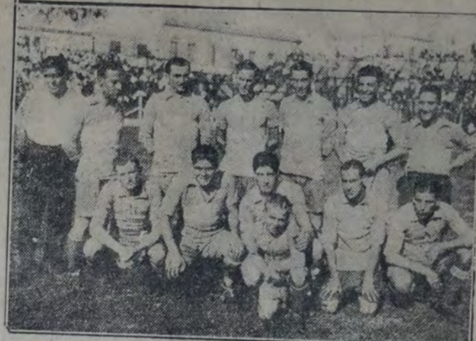
El homogéneo conjunto de Boca Juniors, que conquistó ayer una ruda y laboriosa victoria sobre Almagro.

SAN ISIDRO, 3; G. Y E. LA PLATA, 2 El equipo local, San Isidro, obtuvo un triunfo merecido, ya que a pesar de actuar con cinco jugadores de intermedio, lograron empatar el match y presionar en ciertas oportunidades. El partido fué reñidamente disputado. (Continúa en la página 6a.)